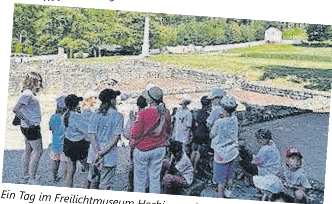
Ein Tag im Freilichtmuseum Hechingen-Stein