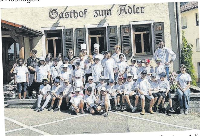
Kochen eines gemeinsamen Indianermenüs im Gasthaus Adler

Bei herrlichem Sommerwetter hatten 33 Kinder eine Woche Spaß und Freude bei gemeinsamen Unternehmungen, Spielen und Ausflügen