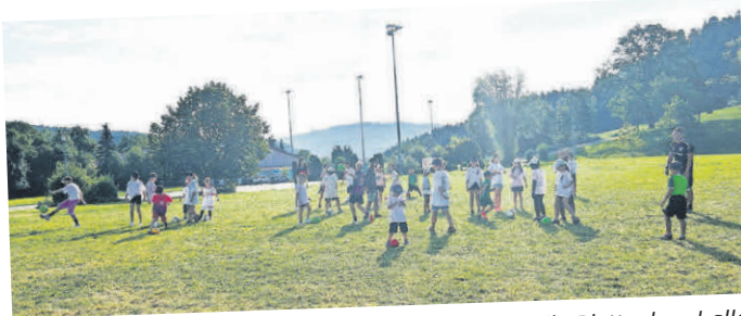
Spiel und Spaß auf dem Freizeitgelände rund um die Plettenberghalle