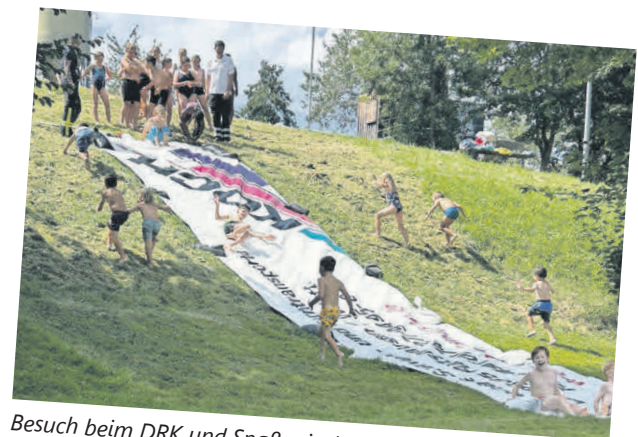
Besuch beim DRK und Spaß mit der Wasserrutsche der Feuerwehr